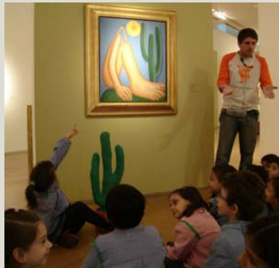
Material realizado por el equipo educativo de Malba

Tarsila do Amaral es una artista que pintó sus obras sin tener un modelo vivo o una imagen como referencia. Ella decía que todo salía de su imaginación y que la tela iba conduciendo lo que ella inventaba. Muchos de sus trabajos presentan imágenes de sus sueños de cuando ella era niña o de historias que le contaban. Sería interesante preguntar a los chicos si tienen sueños cuando duermen y si en ellos aparecen monstruos. Luego, sugerir que elijan un sueño significativo para expresarlo en un dibujo. Con las producciones de cada uno se podría armar una exposición.