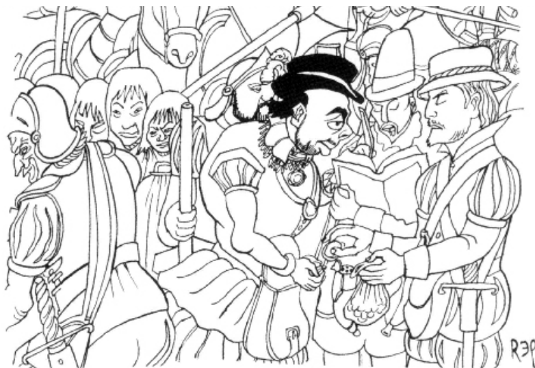
Rep, dibujo a partir de una obra de Rivera

1917 Revolución Rusa. Se funda el movimiento De Stijl