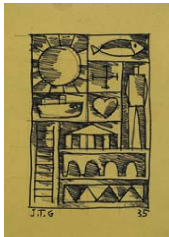
Torres García, Joaquín, Dibujo constructivo con sol y pez , 1935 Malba - Fundación Costantini

Uno de los aspectos fundamentales en la producción de este artista es el rescate, desde un planteo netamente moderno, de la raíz de las manifestaciones precolombinas, con su permanencia y geometría, como eslabón esencial en la conformación de la civilización occidental.