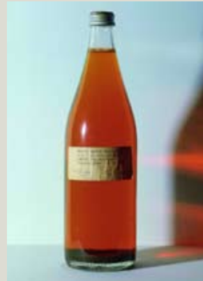
Nicolás García Uriburu Rhein Water Polluted. H2O+10.000 Poisons , 1981 Malba - Fundación Costantini