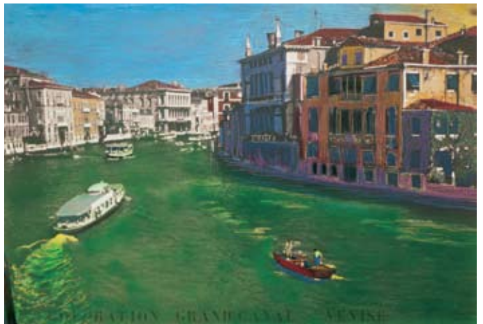
García Uriburu, Nicolás Hidrocromía intercontinental , 1970 Fotografía, pastel 81 x 103 cm c/u Malba - Fundación Costantini